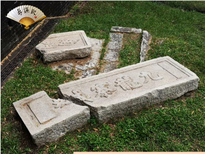
遺下破裂九龍寨城石碑