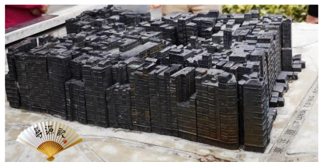
清拆前寨城內樓考密集如鬆糕的彫塑