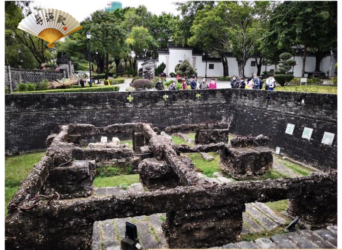
寨城遺址部分供憑吊