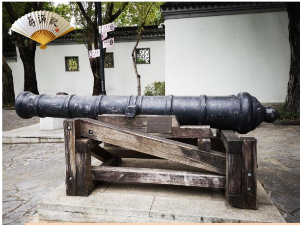
在寨城衙府門前僅留下的古大炮 已有 200 年歷史