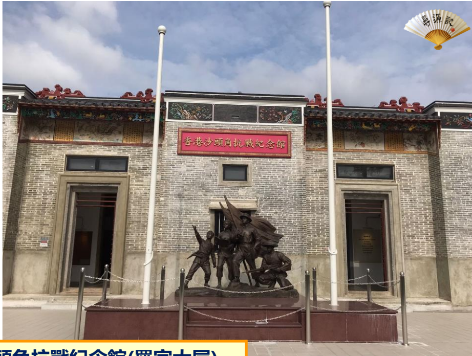
沙頭角抗戰紀念館(羅家大屋)