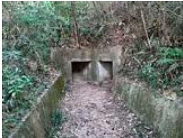
城門碉堡金山防線