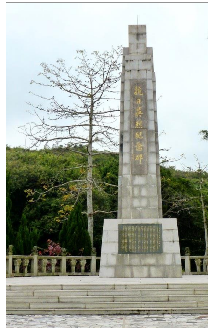
西貢新竹灣抗日烈士園碑